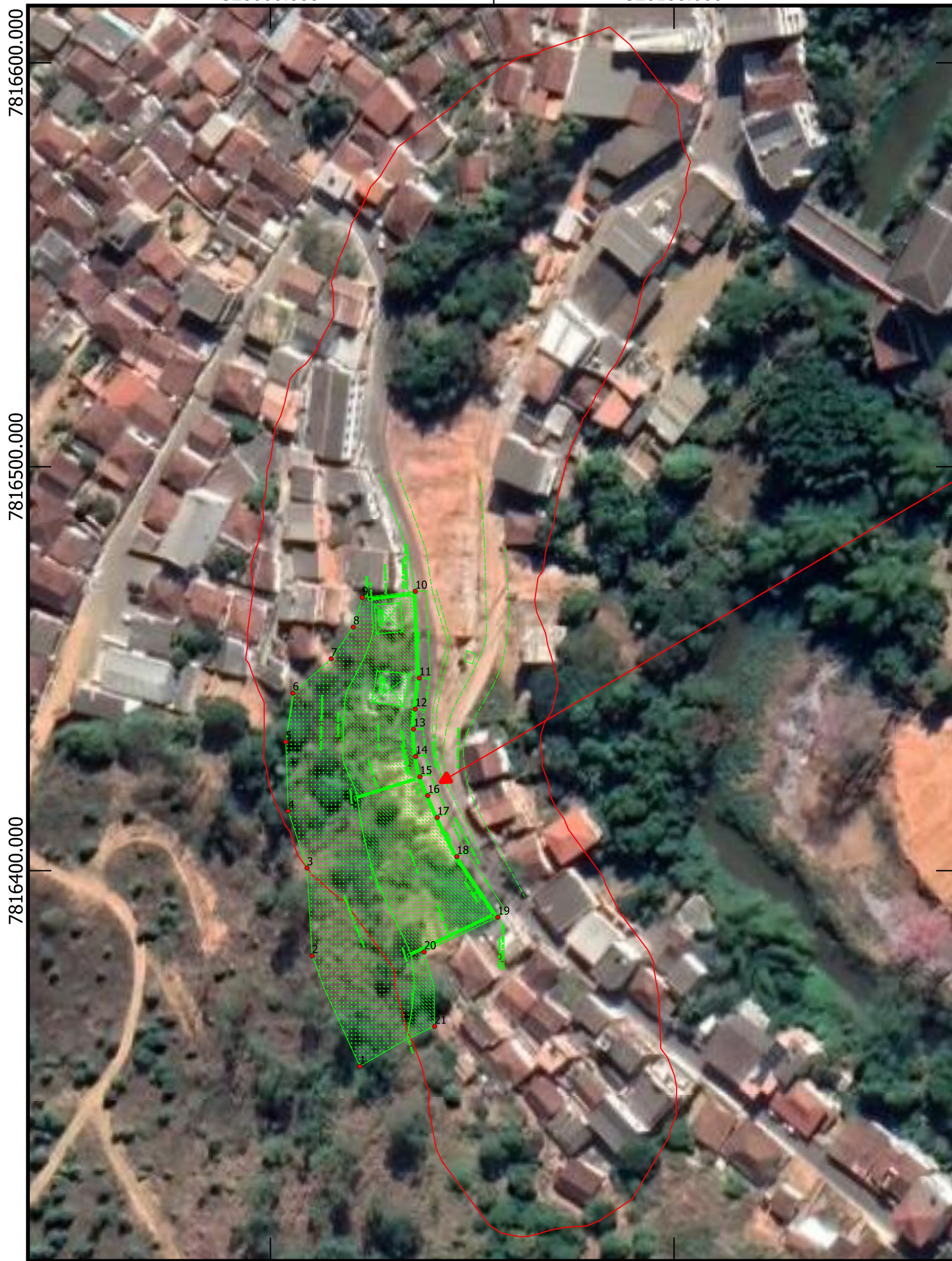
Mapa do Município de São Roque do Canaã